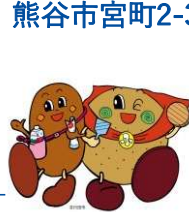
〔R〕行田市 マスコットキャラクター 『こぜにちゃん・フラべえ』