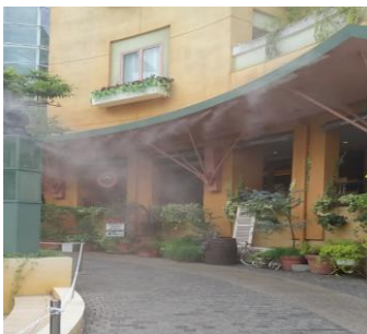
熱中症対策の ミストシステム

当社は各種研究開発用試験装置などを設計、製作、販売している会社です。 主要納品先は自動車メーカー、機械メーカー、官公庁・研究機関、国公立大学と 多岐にわたります。