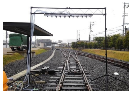
鉄道会社実験用の 豪雨再現装置