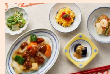
ご自宅でのお食事