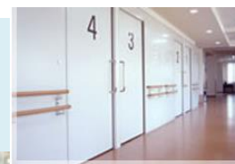
廊下はバリアフリー完備