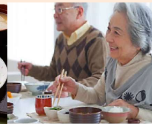
福祉施設のお食事