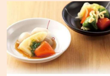
食品・消耗品販売 [医療・福祉・保育施設向け]