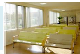
明るいいが差し込む待合室