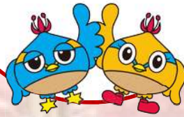
日高市 マスコットキャラクター くりっかー・くりっぴー

日高市生涯 学習センター (図書館) 2階視聴覚室・研修室 (日高市大字鹿山370-20)