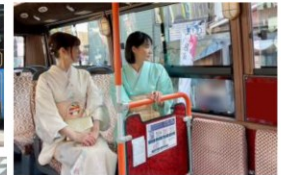
小江戸巡回バスで行く川越観光