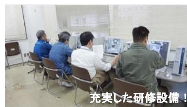
充実した研修設備!