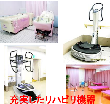
充実したリハビリ機器