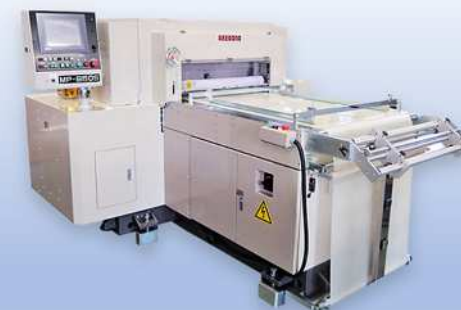
サーボクランク式裁断機