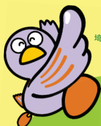
埼玉県マスコット 「コバトン」

コロナ禍でも業務を拡大し広く人材を募集する地域企業が参加! 各企業の人事担当者による個別面談や相談が受けられます!