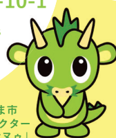
さいたま市 PRキャラクター 「つなが電ヌッ」

JR埼京線・武蔵野線 武蔵浦和駅西口 徒歩3分 ※専用の駐車スペースがありませんので 公共交通機関をご利用ください。