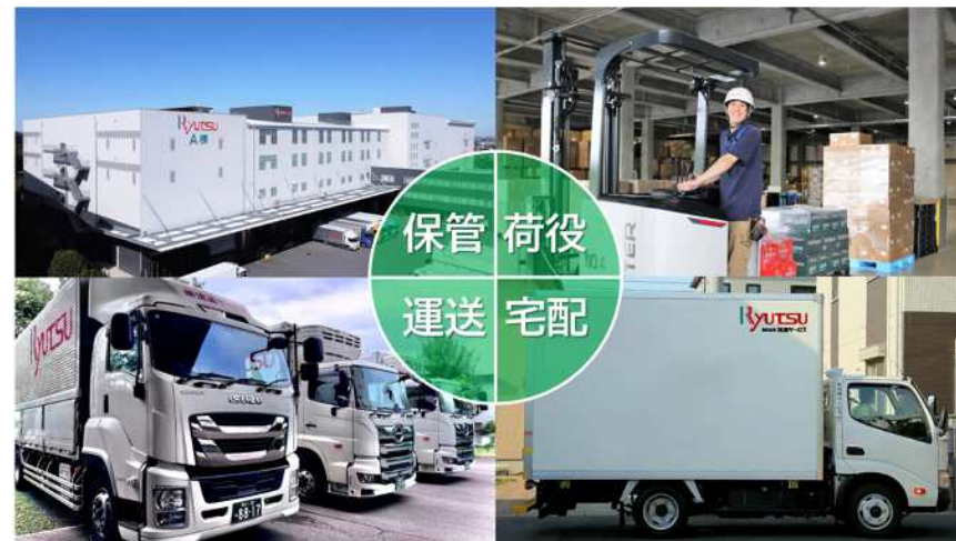
心を込めたサービスを届ける、最新技術と人が支える物流センター