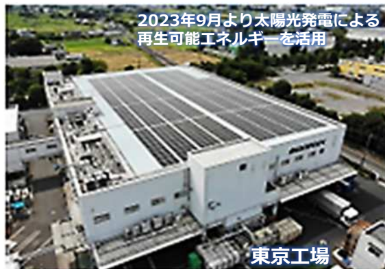
2023年9月より太陽光発電による再生可能エネルギーを活用