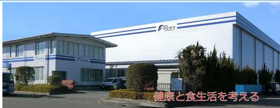
健康と食生活を考える

仕事の内容、採用人数、賃金、就業時間、休日、選考方法等詳細については求人票をご確認願います。