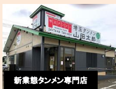
新業態タンメン専門店