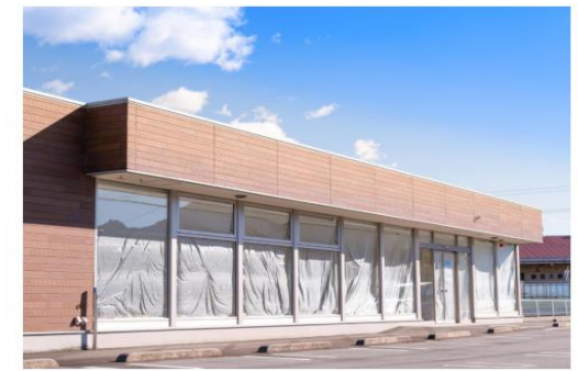
コンビニエンスストア 施工事例