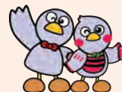
埼玉県のマスコット コノドン&さいたまっち