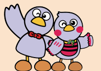
埼玉県のマスコット コバトン&さいたまっちゃん