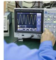
航空自衛隊で使用される無線などの通信機器、光学電子機器や装備のメンテナンスを行い、確かな技術でサポートを行います。