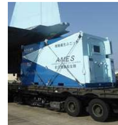
航空機の中で高度な手術が行える、いわば空飛ぶ救急車。現在、航空自衛隊で使われている4台の内3台が当社の製品で、災害時にも命を救うユニットです。