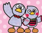
埼玉県のマスコット コバトン&さいたまっちょ