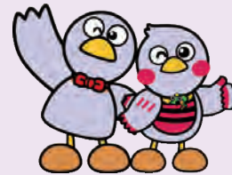
埼玉県のマスコット コバトン&さいたまっち