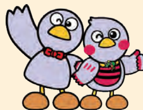
埼玉県のマスコット コバトン&さいたまっち