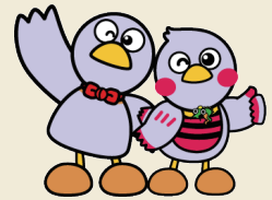
埼玉県のマスコット コバトン&さいたまっち

新型コロナウイルス感染拡大の影響による雇用環境・働き方の変化に対応する 企業の選び方、後半は「ココだから育つ!埼玉にある優良企業の種」について わかりやすく説明します!!