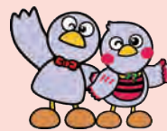
埼玉県のマスコット コバトン&さいたまっちょ

「エゴグラム」は、臨床心理学に基づいた心理テストのひとつ。自分自身の他者とのかかわり方を理解することで、周りの人とより良い関係をつくれるようになります。