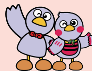
埼玉県のマスコット コバトン&さいたまっちょ

94.7%が就職面接に導入するなど、新型コロナウイルス感染に伴い増えたweb面接。webのみで内定を出す企業も約45%と高め。こういう状況下、人事担当者はどういったところを見ているのか、応募者としてはどういったところを見ればいいのか。企業の採用面接に明るい講師がわかりやすく説明します。