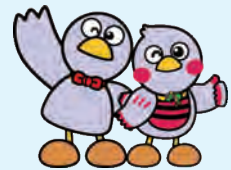
埼玉県のマスコット コバトン&さいたまっち

社会生活において切っても切れない「ストレス」。特にコロナ禍にある今、それはより顕著です。ストレスに対する考え方や処し方を知ること、就活だけでなく、これからの生活に役立てていただけるセミナーです。