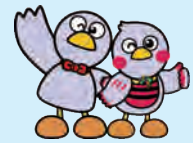
埼玉県のマスコット コバトン&さいたまっち

94.7%が就職面接に導入するなど、新型コロナウイルス感染に伴い増えたweb面接。webのみで内定を出す企業も約45%と高め。こういう状況下、人事担当者はどういったところを見ているのか、応募者としてはどういふところを見ればいいのか。企業の採用面接に明るい講師がわかりやすく説明します。