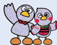
埼玉県のマスコット コバトン&さいたまっち

働き始めてから「こんなはずではなかった…」とならないように、事例などを踏まえて、労働関係の法律の基本を学び、要点を押さえるセミナーです。