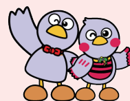
埼玉県のマスコット コバトン&さいたまっち