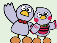
埼玉県のマスコット コバトン&さいたまっち

働き始めてから「こんなはずではなかった…」とならないように、事例などを踏まえて、労働関係の法律の基本を学び、要点を押さえるセミナーです。