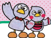
埼玉県のマスコット コバタン&さいたまっち