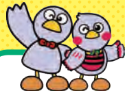
埼玉県のマスコット コバタン&さいたまっちゃん