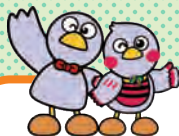
埼玉県のマスコット コバタン&さいたまっちゃん