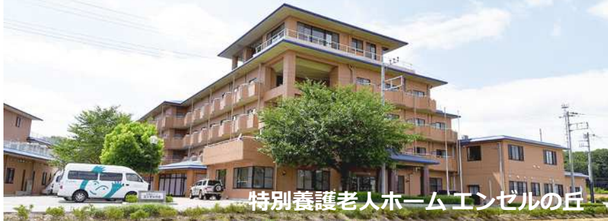
特別養護老人ホームエンゼルの丘

社会福祉法人かつみ会は、埼玉県深谷市を中心に特別養護老人ホームやデイサービスなどの老人介護福祉事業、保育園や学童クラブ（市委託事業）などの保育事業を行っています。