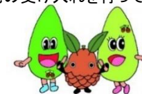
嵐山郷イメージマスコット

東京ドーム約4個分の敷地を有する『嵐山郷』。県立福祉施設を運営する唯一の社会福祉法人として、重度の障害者及び障害児の受け入れを行っています。