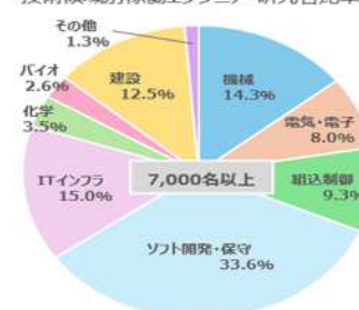
技術領域別稼働エンジニア・研究者比率

電気・電子製品の要件定義、基本設計、詳細設計、製造、運用・保守のサービスを行っています。