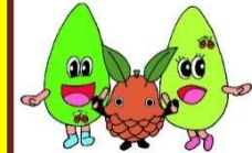
嵐山郷イメージマスコット