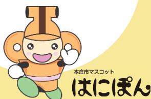
本庄市マスコット