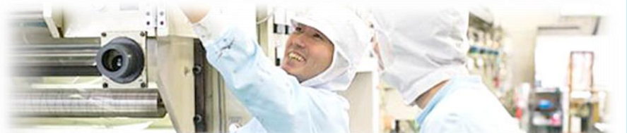
本社、弥平工場は照明をLEDライト化