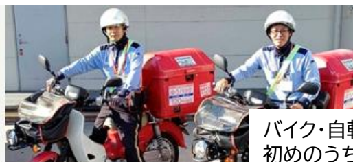
郵便物等配達（自動車）

バイク・自転車での郵便物の配達です。 初めのうちは先輩と一緒に配達してもらいますので未経験の方、ブランクのある方も安心して働けます。