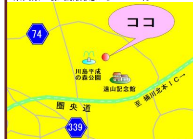
<川島病院アクセス> JR高崎線「桶川駅」・東武東上線「若葉駅」から車15分