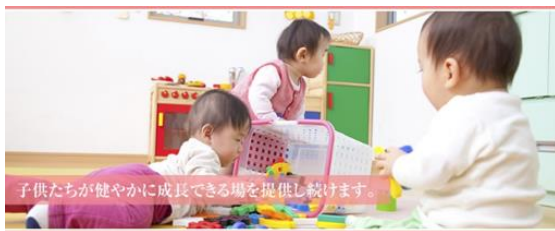
子供たちが健やかに成長できる場を提供し続けます。

職 種:①常勤保育士(イムス三芳総合病院内)／三芳町、 ②非常勤保育士(飯能老年病センター内)／飯能市、 ③非常勤保育補助(川島病院内)／比企郡川島町 雇用形態:①契約社員、②③パート労働者 採用人数、選考方法、賃金、就業時間、休日等詳細については 面接会場配布の資料をご確認願います。