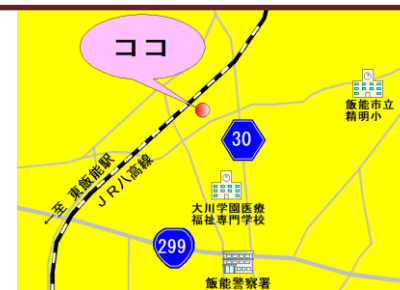
<飯能老年病センターアクセス> JR八高線・西武池袋線「東飯能駅」から車5分