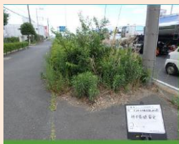
作業する前の状態