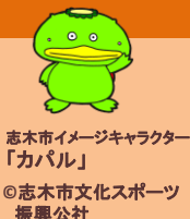
志木市イメージキャラクター 「カパル」 ©志木市文化スポーツ 振興公社