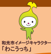
和光市イメージキャラクター 「わこうっち」