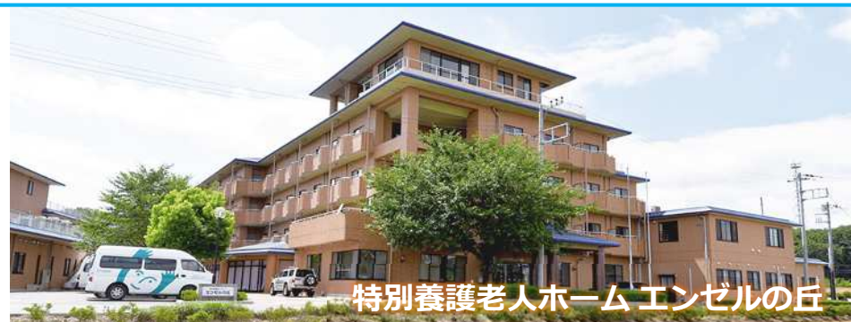
特別養護老人ホームエンゼルの丘