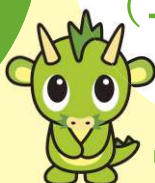
さいたま市 PRキャラクター 「つなが竜ヌウ」