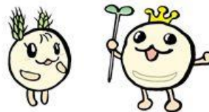
「小麦ちゃん」「ソイキング」