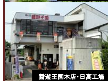
醬遊王国本店・日高工場