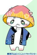
小鹿野町イメージキャラクター「とりにゃん」