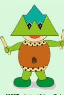
横瀬町イメージキャラクター「ブーたん」