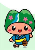
皆野町イメージキャラクター「みへん」