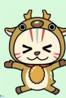
小鹿野町「おがニャッピー」