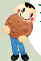
草加せんべいマスコット バリポリくん