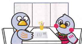
埼玉県のマスコット コバトン&さいたまっち