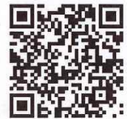
申込みページ二次元コード