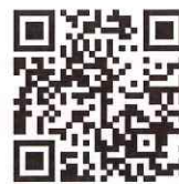
ホームページ二次元コード

セミナーを受講せずに、企業説明会からの参加もできます。申込みフォームよりご回答ください。