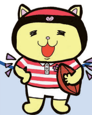
熊谷市 マスコットキャラクター 「ニャオざね」