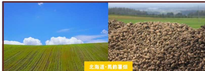
北海道・馬鈴薯畑

ポテトフーズ本社・関東工場のある埼玉県東松山市は埼玉県のほぼ中央に位置し、比企丘陵に囲まれた豊かな自然が特徴です。平成元年に操業が開始されました。