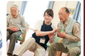
デイサービススタッフ

わたしたちの使命は、「高齢者・障害者の方々が、住み慣れた地域で安心・快適に生活できるよう、必要なサービスを安全・衛生的にお届けし、お客様に喜び・感動・生きがいをもっていただく」ことにあります。したがって、「お客様に喜んでいただければ価値がない」ことをモットーにしています。また、わたしたち自身も生きがいを持ち、そして様々な社会の問題の解決に貢献していくことを目指しています。