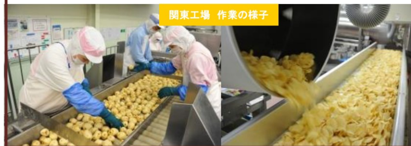
関東工場 作業の様子