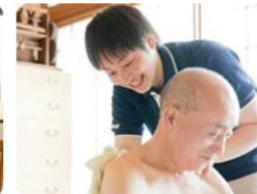
訪問入浴サービススタッフ