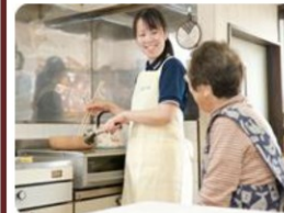
訪問介護サービススタッフ (ホームヘルパー)