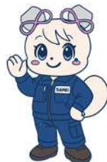
サンエイ公式キャラクター サミーちゃん