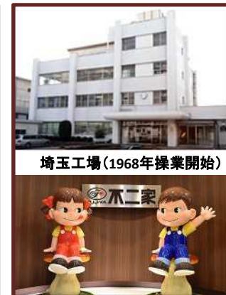
埼玉工場(1968年操業開始)