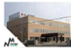
ノーザンミツワ株式会社 本社 (北海道釧路市)